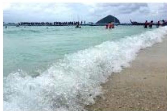
摄影《踏浪》 行政人事部 朱唯隆