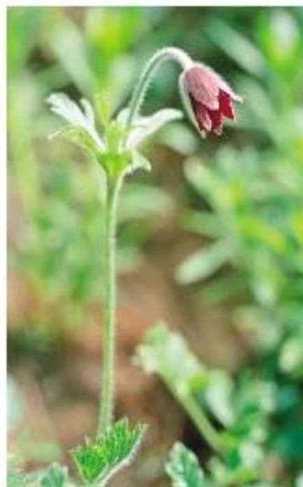
摄影《醒》 采购部 黄正玲