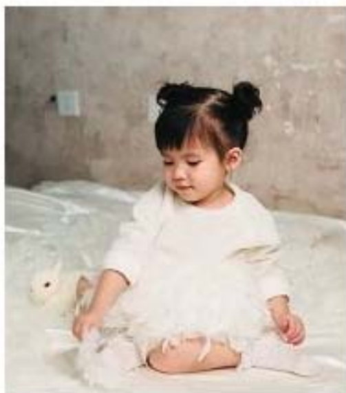
摄影《萌娃》 南宁办事处 苏晓