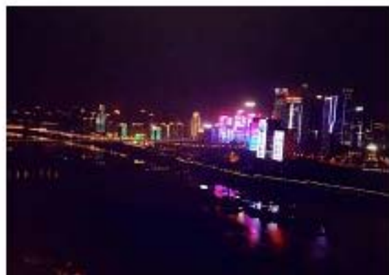
摄影《夜色阑珊》 财务部 邹春风